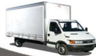
Tranport marfuri / bauturi