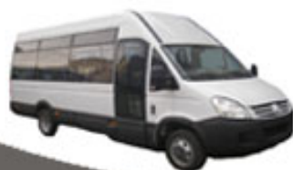
Minibus 8-19 pasageri